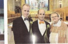
Det samlades cirka 200 personer för att se tv-inspelningen och altartavlans avtäckning.