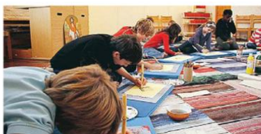
Skolelever i Storvreta målar lotakors.

UNDER en och en halv timme får skoleleverna bekanta sig med ett